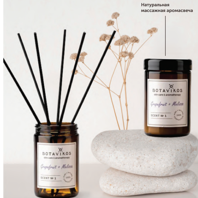
Натуральная массажная аромасвеча

Композиция 100% натуральных эфирных масел: бергамот, элеми, грейпфрут, амирис, мандарин, лайм, литсея кубеба, мелисса