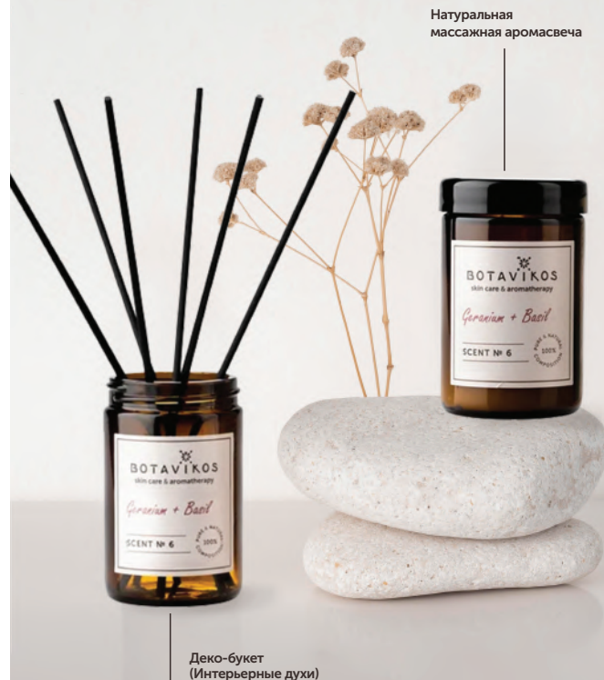
Натуральная массажная аромасвеча

Композиция 100% натуральных эфирных масел: бензойная смола, базилик, герань, роза, бергамот, лаванда