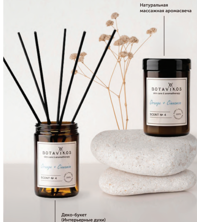
Натуральная массажная аромасвеча

Композиция 100% натуральных эфирных масел: апельсин, бергамот, кедр, ладан, розовое дерево, элими, корица, роза