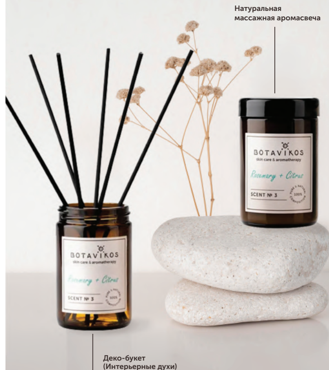
Деко-букет (Интерьерные духи)

натуральных эфирных масел: цитрус (клементин), лимон, мандарин, розмарин, розовое дерево, элеми, литсея кубеба, кедр, можжевельник